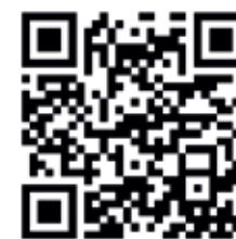
ФОТО И ОПИСАНИЯ БЛЮД