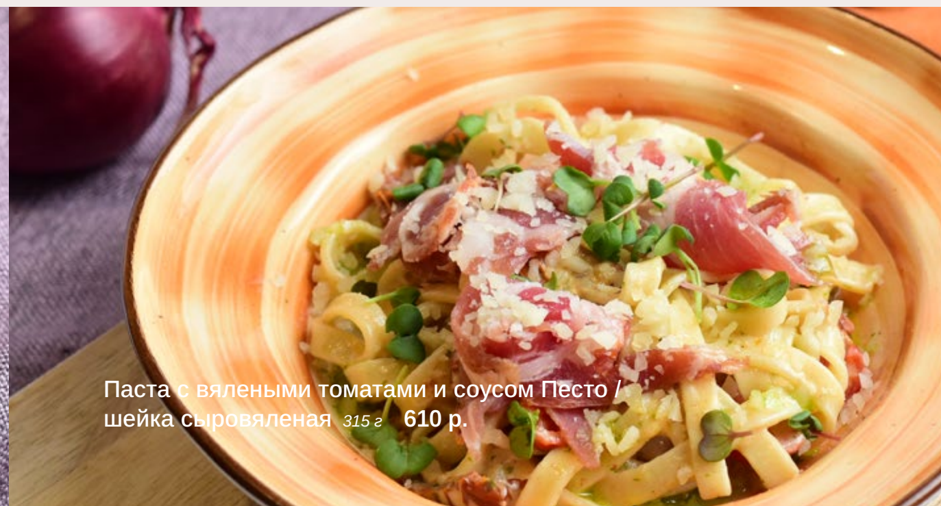
Паста с вялеными томатами и соусом Песто / шейка сыровяленая 315 г 610 р.