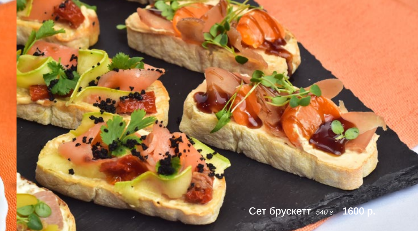
Сет брускетт 540 г 1600 р.