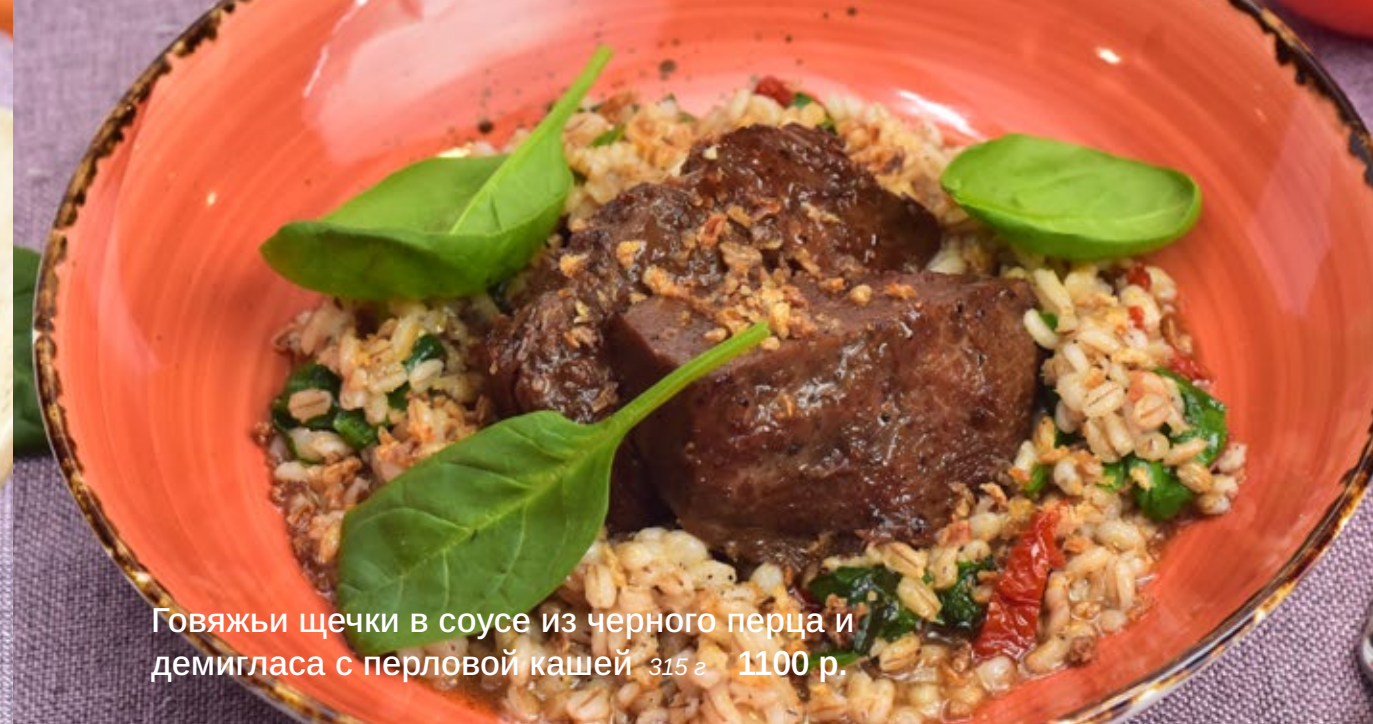
Говяжьи щечки в соусе из черного перца и демигласа с перловой кашей 315 г 1100 р.