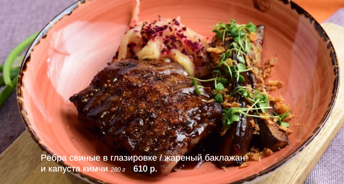
Рёбра свиные в глазировке / жареный баклажан и капуста кимчи 280 г 610 р.