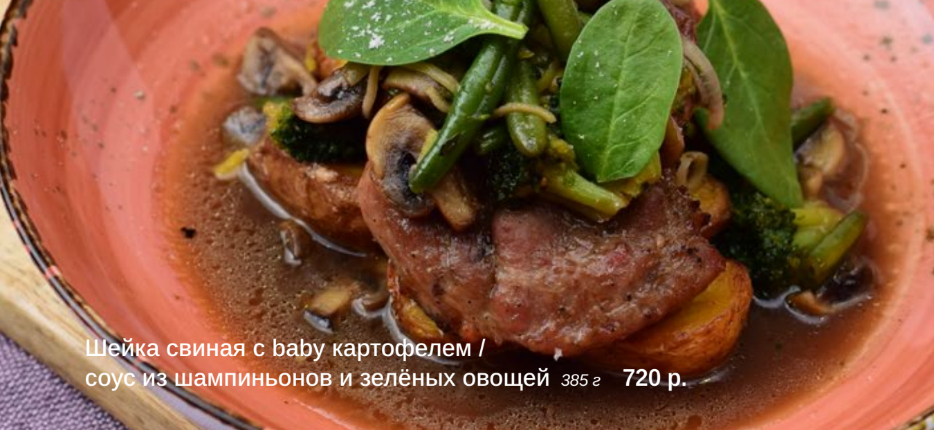
Шейка свиная с baby картофелем / соус из шампиньонов и зелёных овощей 385 г 720 р.