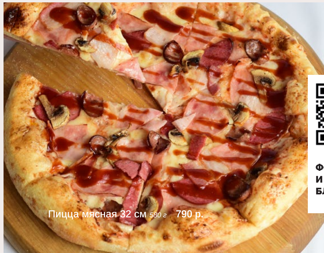
Пицца мясная 32 см 580 г 790 р.

Барон, Фараон, Горячая Филадельфия 640 г