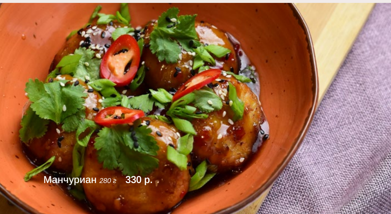
Манчуриан 280 г 330 р.

Паста ручной работы в сливочном соусе с песто, свежими и вялеными томатами под сыром пармезан и слайсами сыровяленой свиной шейки 315 г