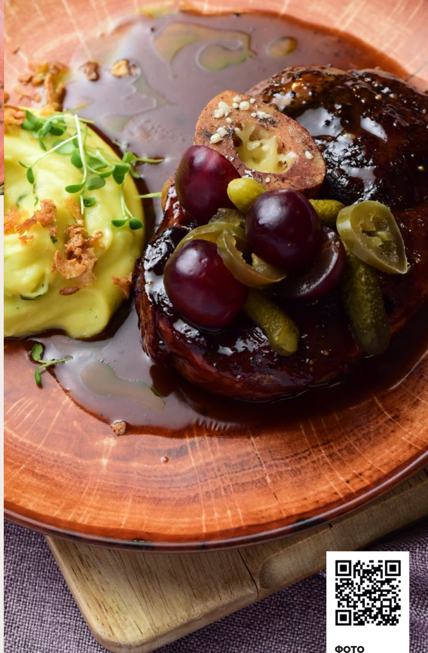
Оссо-Буко с соусом Чёрный перец / сырное пюре с кинзой / копчёный виноград с халапеньо 450/165/50 г 2400 р.

Кусочки куриного филе, жаренного с белыми грибами в сливочном соусе, с гарниром из картофеля и овощей 255 г